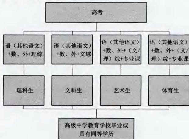
图1 3+X模式(大部分省市)

2004年,广东、海南、宁夏、山东等地率先进行新课程改革的试点 [20] 。与之前课程相比,新课程在课程的设置、目标、内容、评价等方面都有明显的改进。根据《基础教育课程改革纲要》(试行)的精神,新课程结构主要有以下特点:均衡性、选择性和综合性 [21] 。由于更多的省份加入到新课改的进程中,这就导致了各地之间的差异更明显。这些差别也将直接体现到新高考改革方案中来,使各地高考科目的设置与内容安排更加多样化 [20][133-134] 。考试的科目主要包含语文、数学、外语、政治、历史、地理、物理、化学、生物等九门功课。语数外是每个考生必考科目,文综(政治、历史、地理)、理综(物理、化学、生物)作为选考科目,考生可以根据自身的情况选择报考。文科生选择语数外+文综,理科生则选择语数外+理综的形式,其他考生根据自己属于文理科选择相应的考试科目。此外,由于考试模式的不同(3+X模式、3+6模式、3+X+其他模式),考试的内容也会存在相应的差距。主要表现如图1和图2所示。